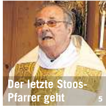
Der letzte Stoos-Pfarrer geht 5

Bote der Urschweiz Schmiedgasse 7, 6431 Schwyz www.bote.ch Redaktion: Fon 041 819 08 11 Fax 041 811 70 37 redaktion@bote.ch Abonnemente: Fon 041 819 08 09 Fax 041 819 08 53 abo@bote.ch Inserate/Anzeigen: Fon 041 819 08 08 Fax 041 819 08 17 inserate@bote.ch