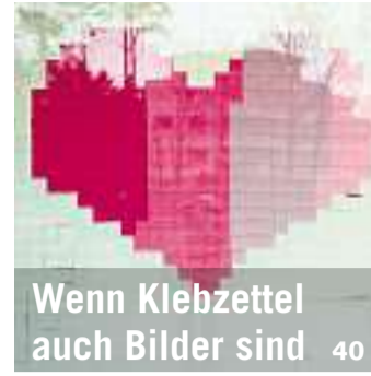
Wenn Klebzettel auch Bilder sind 40